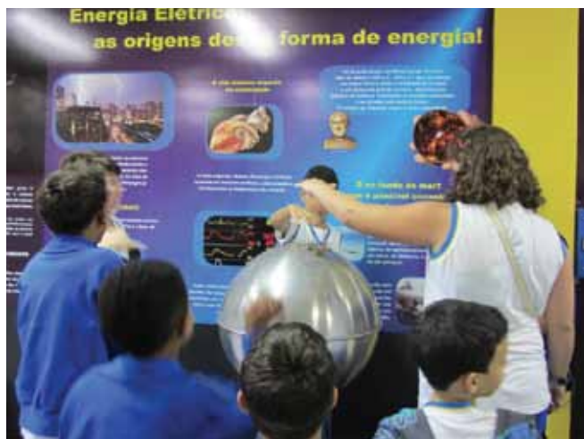
Figura 1. Exposição “Energia e Vida”