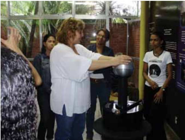
Figura 3. Professores do mini-curso interagindo com o módulo “Eletricidade e Magnetismo”.

absolutas. Contudo, sabemos que a geração e a comunicação de conhecimento são cada vez maiores e mais ágeis, principalmente com o advento da internet . (Zamboni, 2001). Em decorrência das constantes atualizações de informações e conhecimento, a formação inicial dos professores por si só, acaba não sendo suficiente ao educador, ao longo de sua vida profissional. Por isso, é de grande valia que o professor participe de programas de formação continuada de professores.