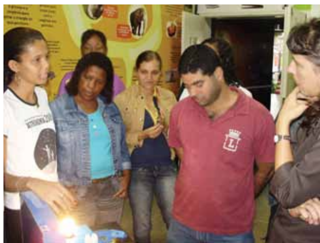
Figura 2. Professores do curso de capacitação interagindo com o módulo “Consumo de Energia”

realidade da Baixada Fluminense, apresentando por último, vídeos que tratavam de alguns temas abordados na exposição.